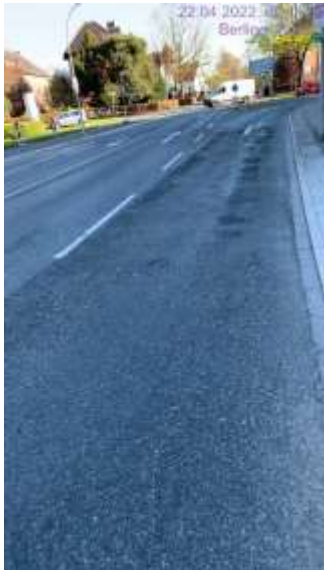
Berliner Platz / Mühlenweg