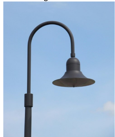
BEGA 7911 Bogenleuchte