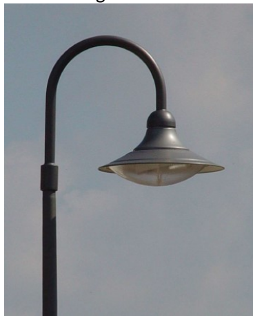
Trilux 9311 Bogenleuchte