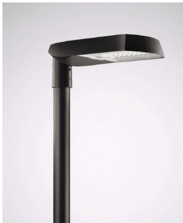
CUVIA 60 Techn. Leuchte

Seitens Westnetz wurden drei mögliche Leuchten inkl. Kosten (netto, je Leuchte inkl. Mast und Montage) vorgestellt: