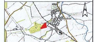
Übersichtskarte (Openstreetmap) Maßstab 1:50.000

Bereich: Bebauungsplan "Sondergebiet Photovoltaikanlage Walskoppel", Wefensleben