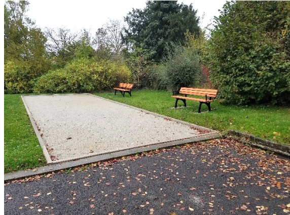
2. Boulebahn beim Spielplatz in Haddessen