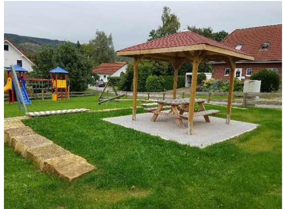
Unterstand und Sitzgelegenheiten in Pötzen