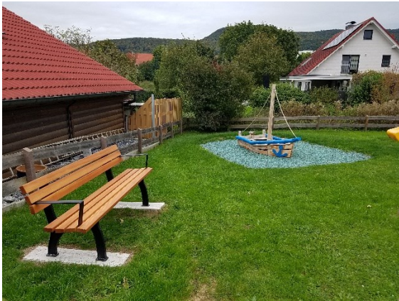
Bank und Spielschiff beim Spielplatz in Pötzen