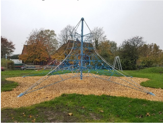
Kletternetz beim Spielplatz in Haddessen