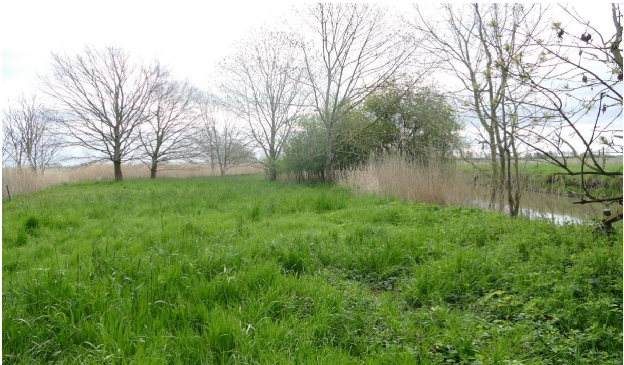
Blick auf die Wiese, dahinter das Schilffeld. Rechts der Inkersfleth