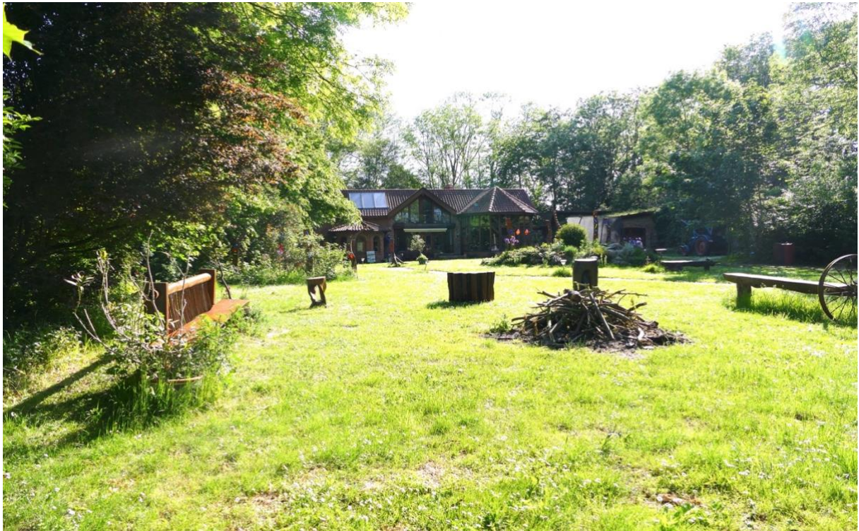
Blick in östlicher Richtung auf das Wohnhaus