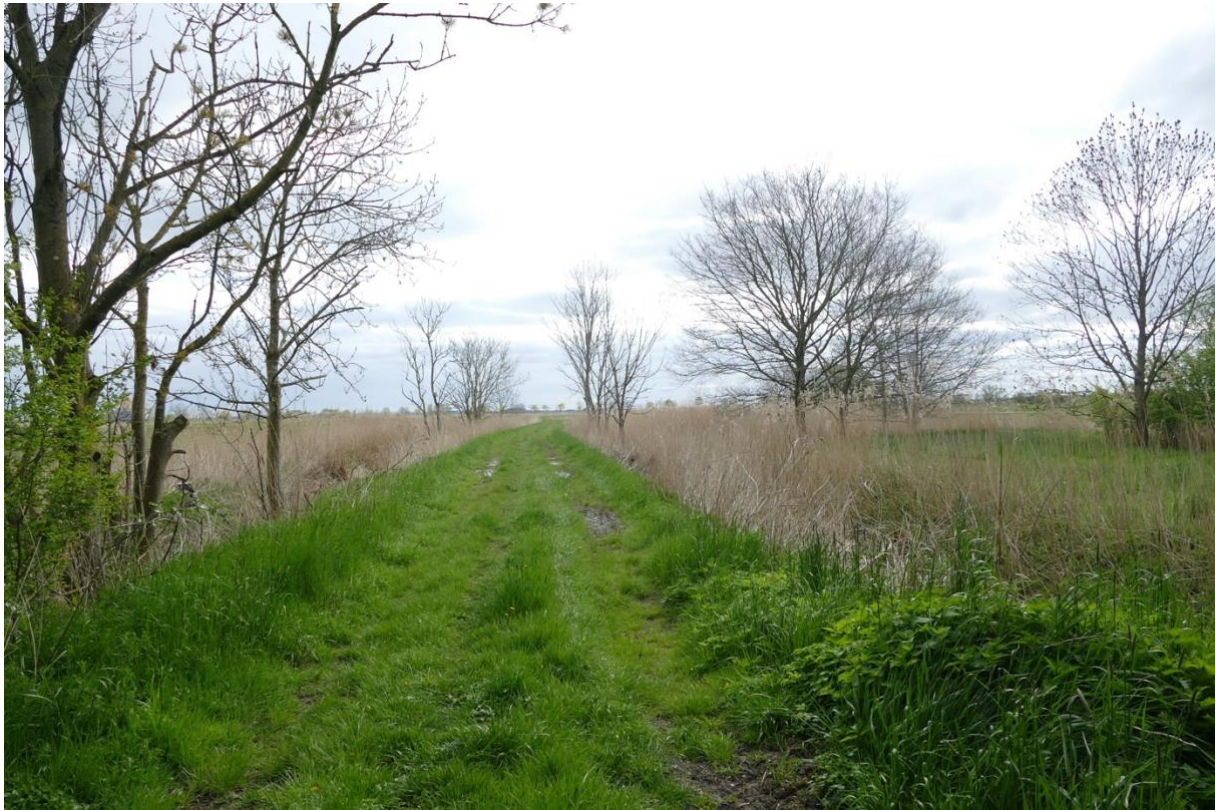
Der Zwischendeichsweg in östlicher Richtung, rechts eine Wiese dahinter das Schilffeld. Links die angrenzenden Wiesen