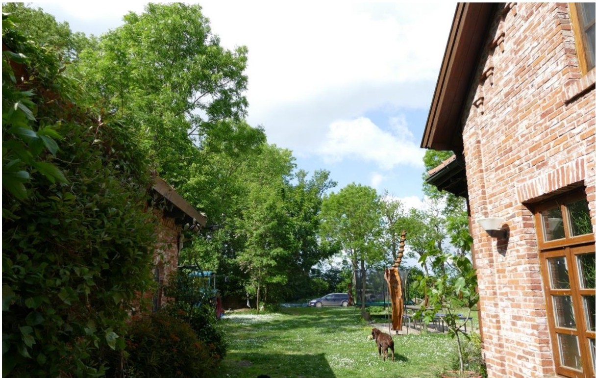
Blick in westlicher Richtung, rechts das Wohnhaus, links die Werkstatt und der Stall