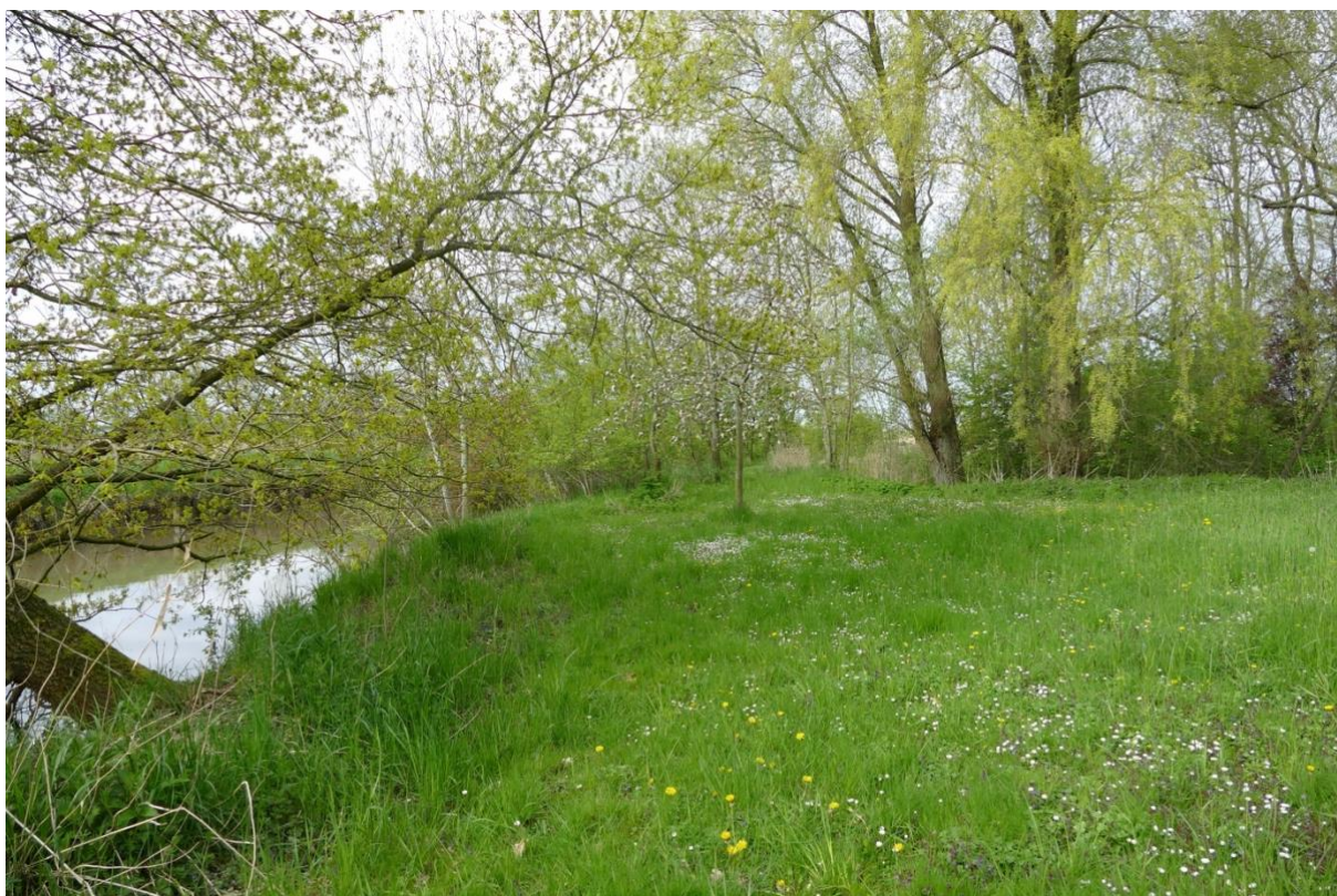
Die südliche Grundstücksseite. Blick in westlicher Richtung, links der Inkersfleth