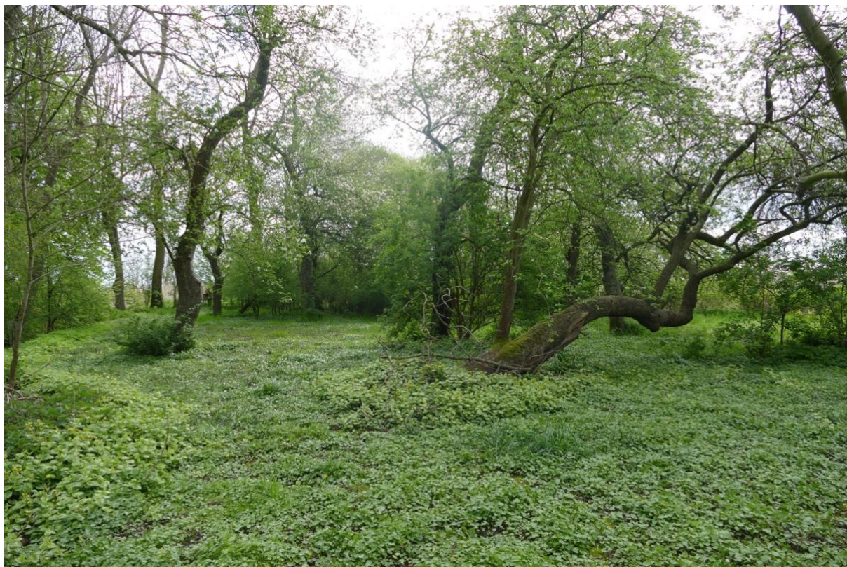
Die südliche Grundstücksseite. Blick in östlicher Richtung, links der Zwischendeichsweg