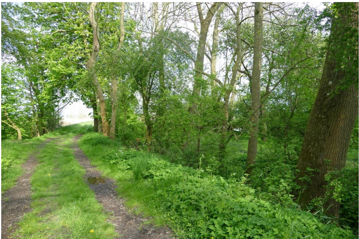
Blick auf den Zwischendeichsweg in östlicher Richtung