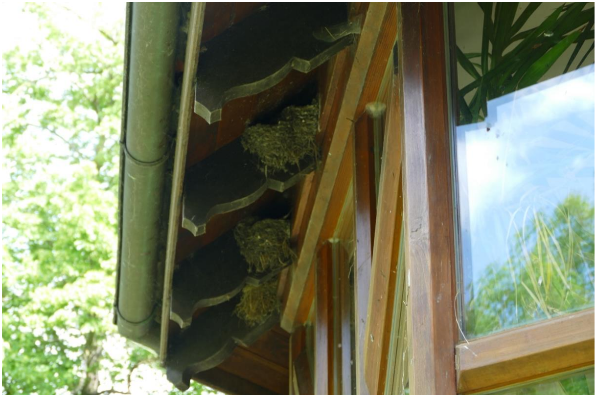
Ein Teil der Rauchschwalbennester am Wohnhaus