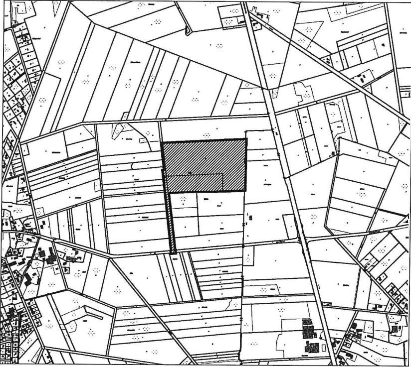
Abgrenzungsvorschlag des Vorhabenbezogenen B-Planes „Industriegebiet Wulfheide“